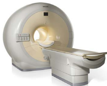
1.5T MRI装置（フィリップス社製）